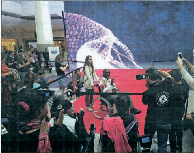
Valide et non-valide, malvoyant, en fauteuil, etc. Trente personnes ont défilé, hier, sur la place centrale de Cap 3000, à l'initiative de la mairie et de l'association « Handica services 06 » pour changer le « Regard sur la différence » et montrer que la beauté n'a pas de limites.